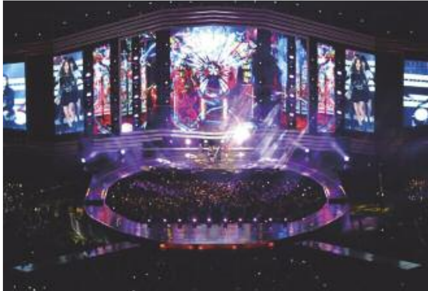
세계 최대·최고의 한류콘텐츠 '부산원아시아페스티벌'이 낙동강변에서 펼쳐진다.

문화예술 생산공간이자 발표무대로 변화시킬 2019부산거리예술축제는 부산시, 부산문화재단, 우리 구가 후원을 맡았으며 감남진피지컬씨어터가 주관한다. 행사는 10월 첫째 주말인 10월 5~6일 구포역 일원에서 펼쳐지며 각국의 예술가들이 참여한다.