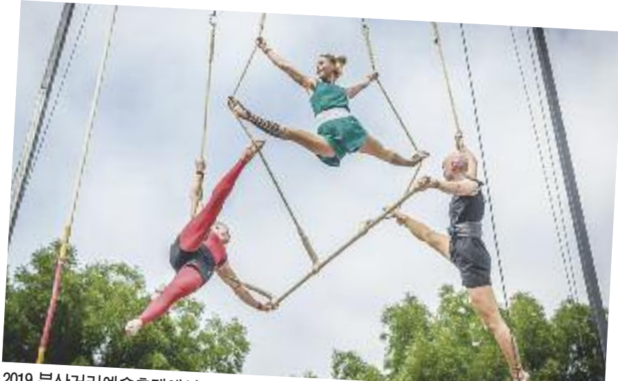
2019 부산거리예술축제에서 공연할 핀란드 공중그네팀 '와이즈폴츠'