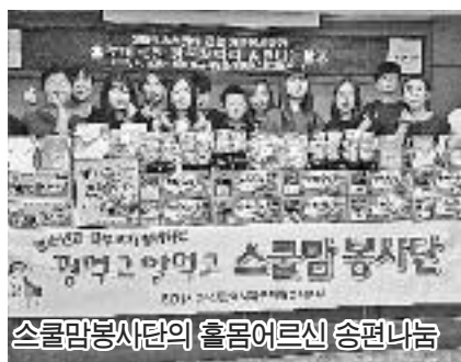
스쿨맘봉사단의 홀몸어르신 송편나눔

만덕3동에서는 착한교회가 쌀 10kg 7포를 기탁했으며 덕양초등학교 학생들이 생필품 모아서 17가정에 전달했다. 새마을부녀회는 어르신 180여명에게 삼계탕을 대접했다.