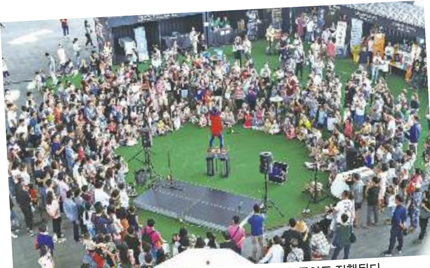
수제맥주의 세계로 이끌어줄 수제맥주 마스터스 챌린지. 공연도 진행된다.