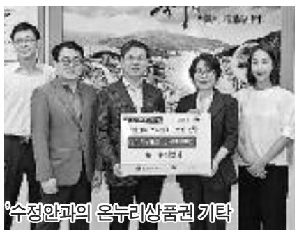
'수정안과'의 온누리상품권 기탁