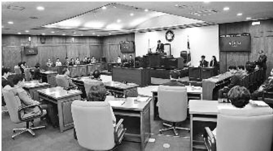
북구의회가 제235회 임시회를 9월 17일부터 25일까지 운영하였다.

의회는 회기 첫날인 17일에는 제235회 임시회 개회식과 1차 본회의를 차례로 열었으며 회기 결정의 건, 서명의원 선출의 건, 휴회의 건을 처리했다. 5분 자유발