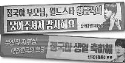
방탄소년단 정국의 생일을 맞아 팬들이 우리구의 게시대에 내건 축하 현수막

팬클럽은 정국의 고향인 우리 구의 결식아동과 청소년을 위한 기부서포트를 진행했으