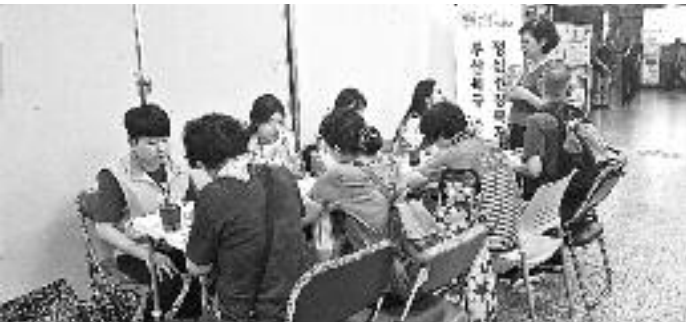
북구정신건강복지센터가 9월 10일 덕천역에서 진행한 자살예방캠페인

또 자살예방을 위해 자살위험 상담전화(☎1393)를 운영하면서 고위험군에 대한 선별검사와 상담을 진행한 후 필요한 경우 전문 의료기관에 의뢰한다. 자살유가족에게는 상담과 치료비를 지원한다. 정신건강과 관련해 도움이 필요한 경우 전화로 예약한 후 센터를 방문하면 된다. 문의 ☎334-3200, 309-4827