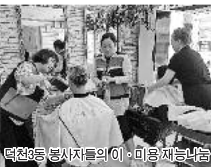
덕천3동 봉사자들의 이·미용 재능나눔

신덕초등·만덕초등 학생들이 집에서 가져온 기부물품들 취약계층 주민에게 전하기도