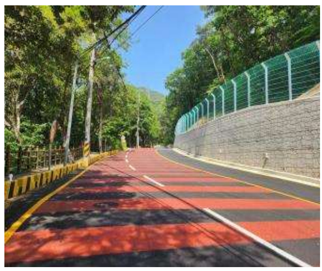
개선 후(보도폭 확장 및 옹벽설치)