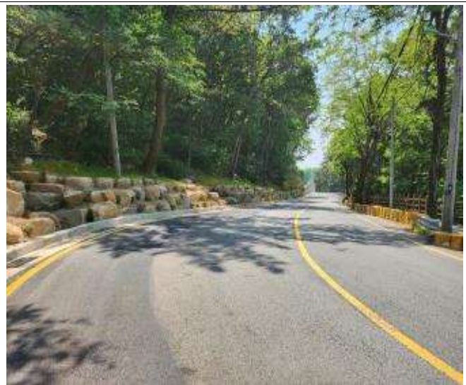
개선 후(보도폭 확장 및 측구설치)