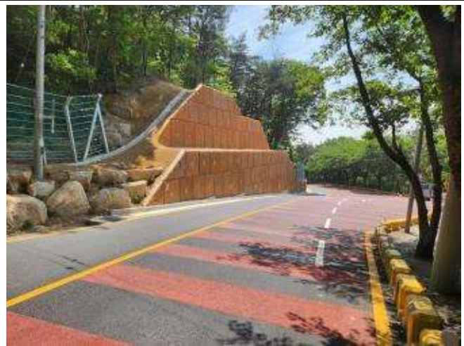
개선 후(보도폭 확장 및 옹벽설치)