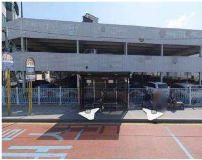
개선 전(좁은 보도폭, 노후 승강장)