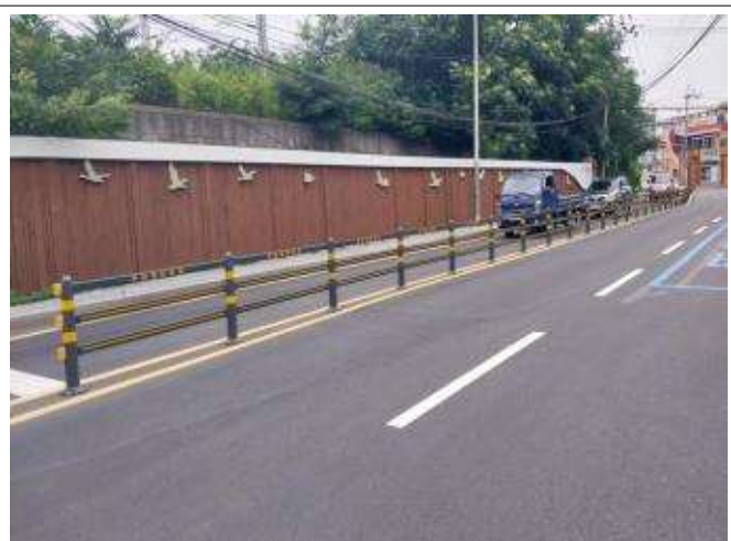
개선 후(무단횡단방지 차선분리대 설치)