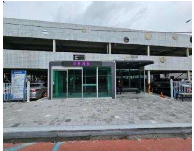
개선 후(보도폭 확장 및 스마트승강장 설치)