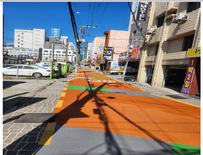
개선 후(패턴형 블록포장)