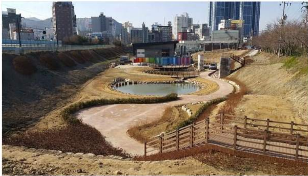
▲ 덕천유수지가 비점오염 저감시설을 갖춘 친환경 인공습지로 조성된다.

등이 그대로 유입돼 시커먼 기름띠와 각종 부유물이 떠다니고, 악취까지 진동했다. 특히 이 오염물질들이 그대로 낙동강까지 흘러 들어가 낙동강 수질을 악화시키는데도 한몫했다.