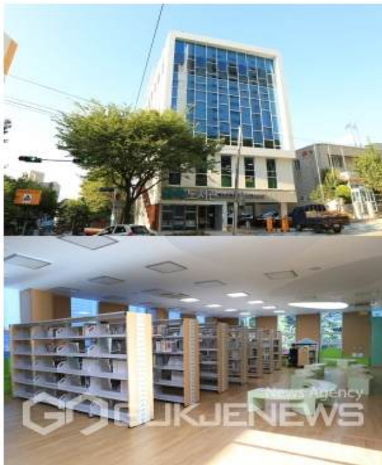
▲ 금곡도서관 내외부 모습

부산 북구 금곡도서관은 2012년 주민참여사업 장기 검토과제로 선정된 후 지난해 착공식을 거쳐 지하 1층 지상 5층 연면적 1772.63㎡ 규모로 완공됐다고 20일 밝혔다.