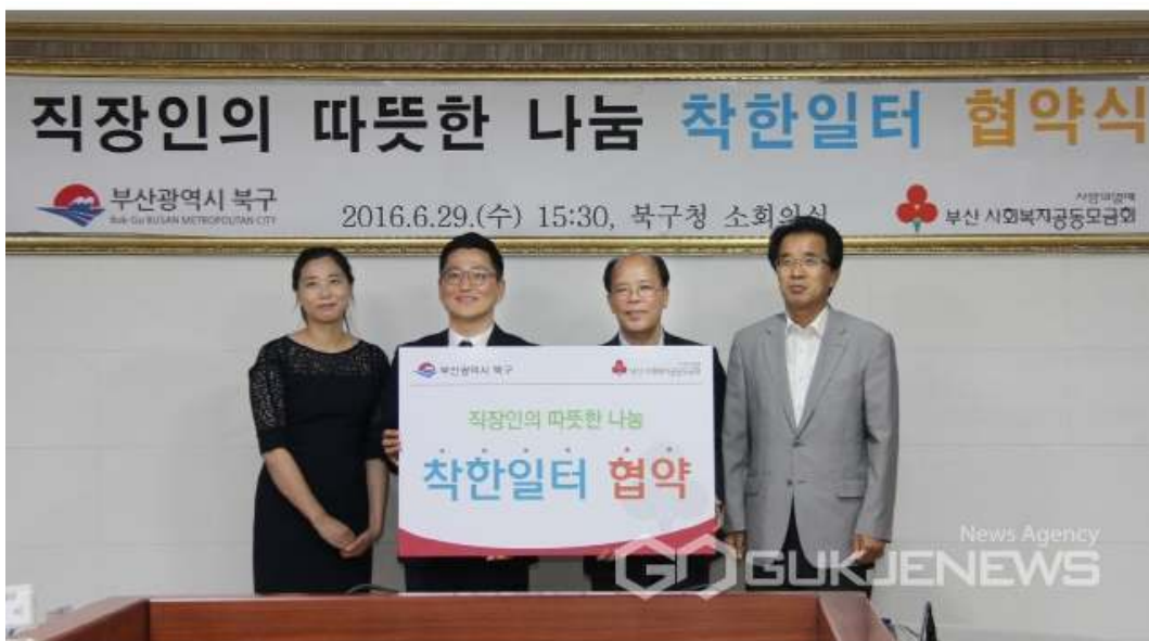
▲ 부산 북구는 부산사회복지공동모금회와 지난 29일 북구청 소회의실에서 착한일터 업무제휴 협약을 체결했다