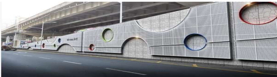
▲ 복구청이 9억 1000만 원의 예산을 투입해 구포대교와 대동화명대교 등에 경관 개선 사업을 실시한다. 대동화명대교의 조감도..