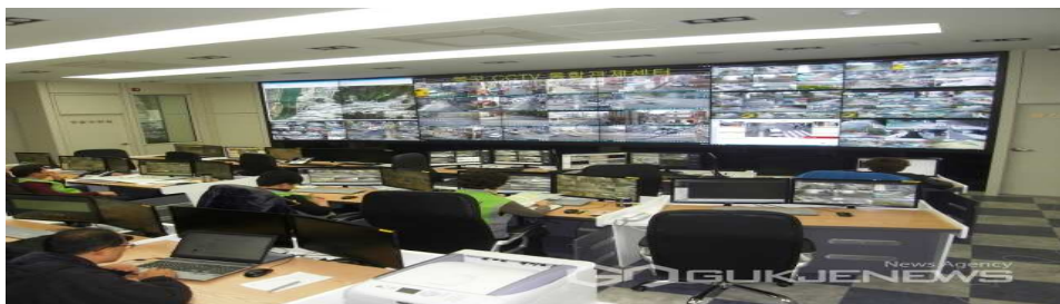
▲ 부산 북구 CCTV 통합관제센터 모습

부산 북구 CCTV통합관제센터는 지난달 범죄 현장을 발견해 현행범을 검거한데 이어 이번에도 특수절도 피의자를 검거하는 성과를 올렸다.