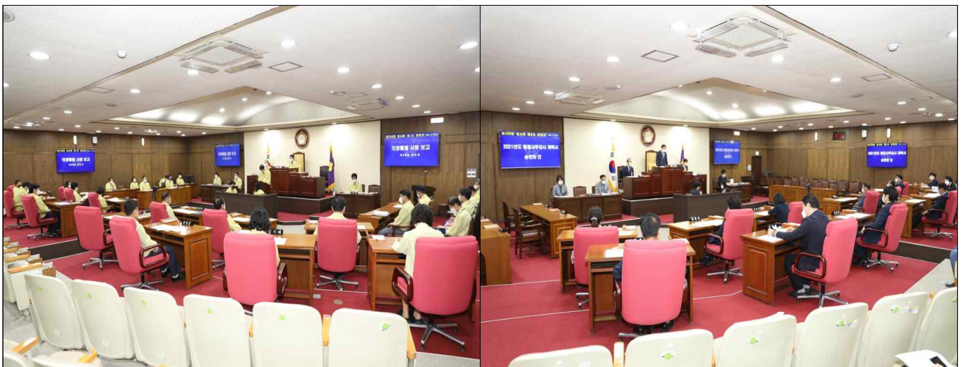
제250회 임시회 제1차 본회의 장면