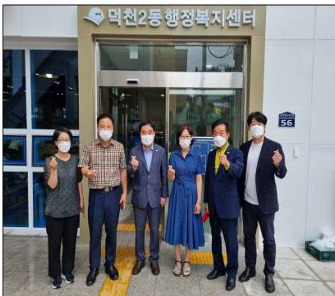
2021.8.23. 지방의회30주년 기념 온택트 정책포럼 참석