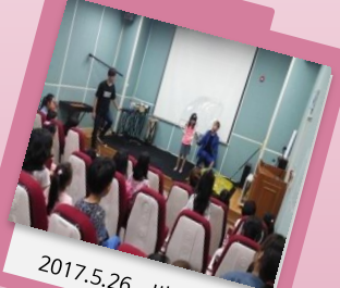
2017.5.26. 버블쇼 공연