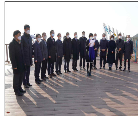
2021.2.18. 동남권 관문공항 정책토론회 참석