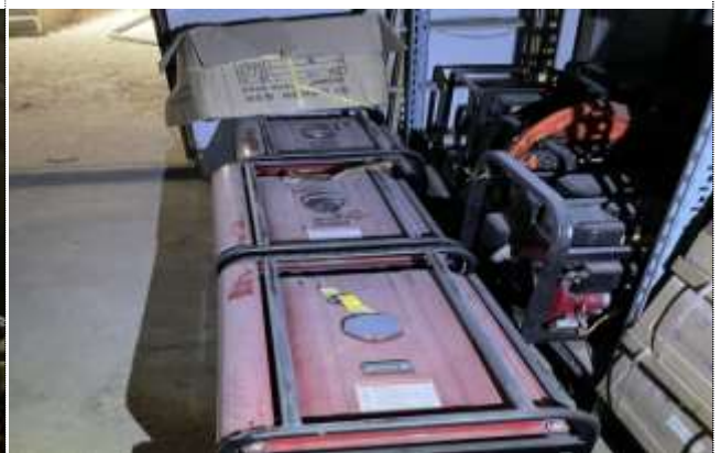
품목별 라벨 미부착