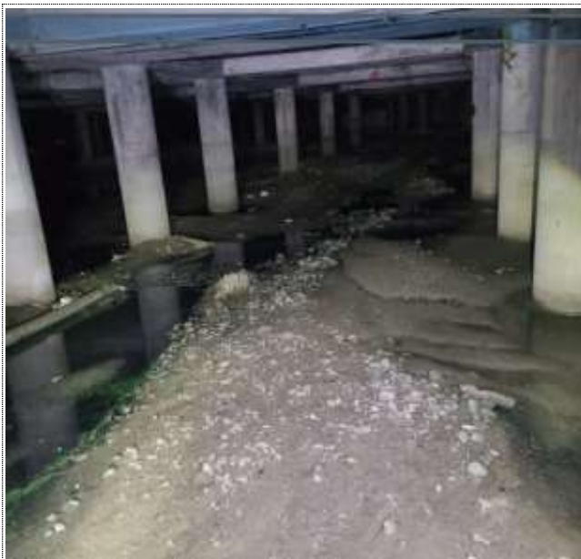
구포 배수펌프장 유수지(H=30cm) (2022년 정밀안전점검 결과)