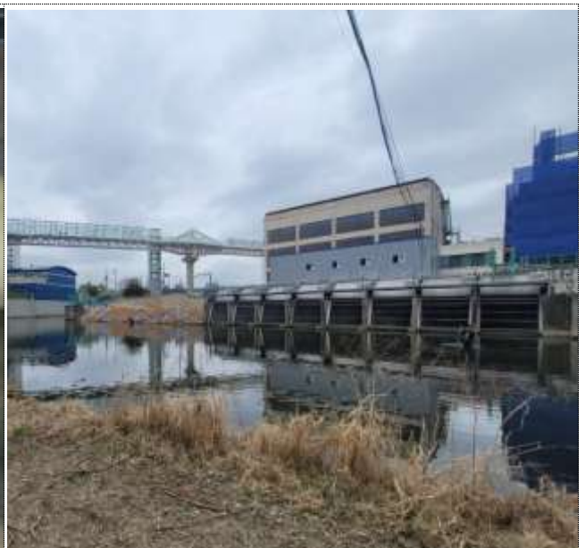
덕천배수펌프장 유수지 (준설공사 2023. 4 ~ 6)