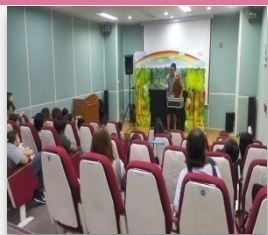
[디지털] 2018.9.15. 인형극 공연