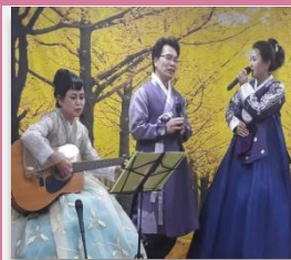
[금곡] 2018.10.17. 시낭송 콘서트