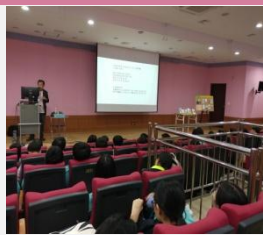
[화명] 2018.9.28. 해피북데이