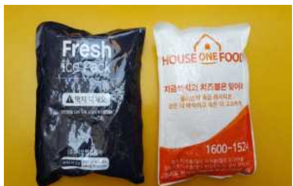
▲ 오래되고 낡은 것