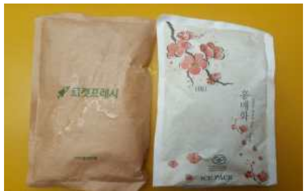
▲ 종이·부직포 포장재