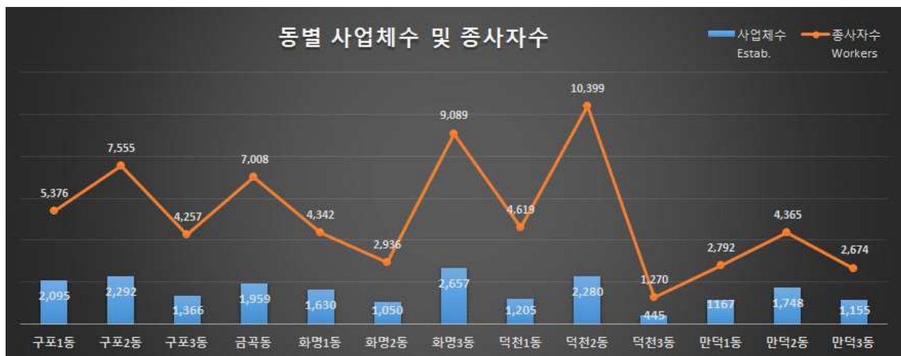
표2] 동별 사업체수 및 종사자수 현황