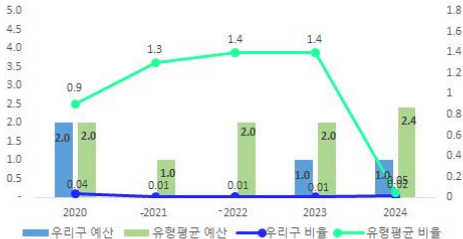
최근 5년 국외여비 규모 및 비율 현황

우리 구의 국외여비 예산액은 유형평균 지자체에 비해서 낮은 편입니다. 총예산에서 차지하는 국외업무여비 예산 비율 또한 유형평균에 비해 낮은 수준입니다.