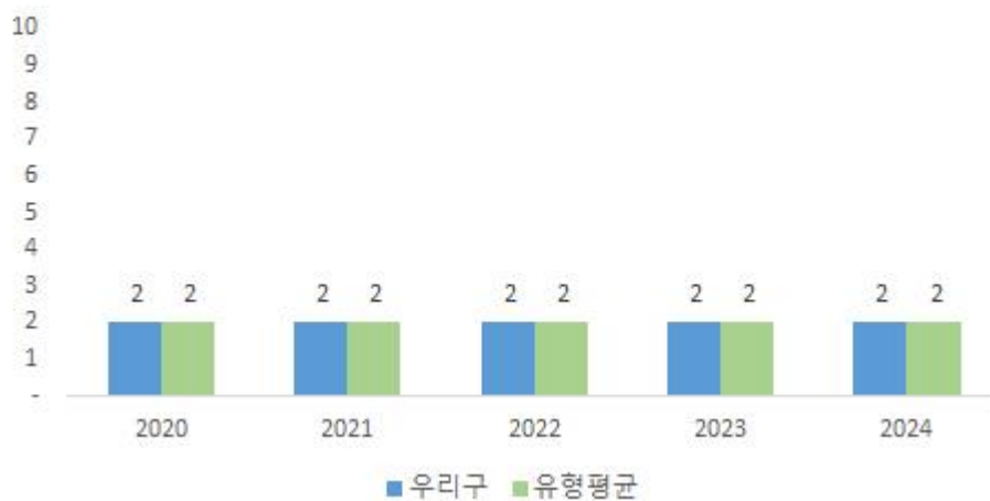
최근 5년 지방의회 관련경비

우리 구의 지방의회관련경비는 동일 추세이며, 동일 유형 지자체 평균과도 동일합니다.