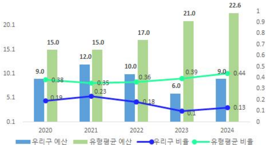
최근 5년 행사축제경비 규모 및 비율 현황

우리 구의 행사축제경비 예산은 코로나 이후 지역행사 증가로 인해 지속 상승추세이나, 2024년 기준으로 총예산액 대비 행사축제경비 예산액비율은 동일유형 평균에 비해 낮은수준입니다.