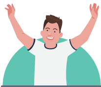
건강상태 좋을 때 접종