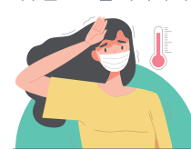
발열, 메스꺼움, 근육통