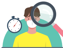
접종기관에서 이상 반응 관찰